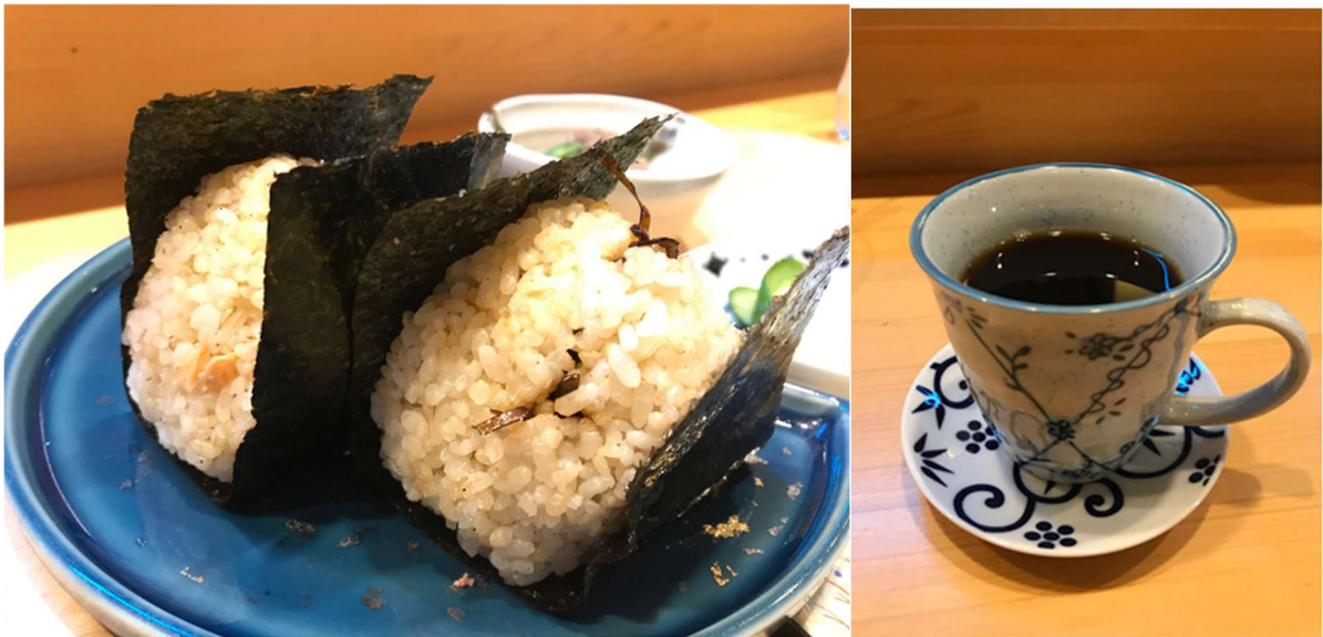
玄米おにぎり（昆布、鮭）

「玄米おにぎりセットは6種類の味が選べます。味噌汁、漬け物、お惣菜、食後のコーヒー又はお茶が選べる充実した構成となっております。」