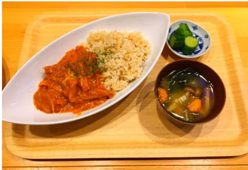
グルテンフリーのカレーセット

「玄米おにぎりセットは6種類の味が選べます。味噌汁、漬け物、お惣菜、食後のコーヒー又はお茶が選べる充実した構成となっております。」