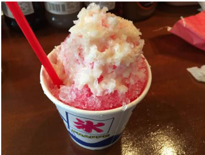
キンキンに冷える「粗びき」のかき氷は熱中症対策に最適です！